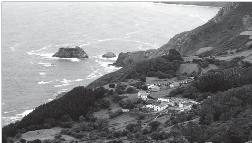
Vista de San Andrés de Teixido y la 'barca' del santo.

Después de un amplio estudio que relaciona las tradiciones celtas y ciertos lugares de tradición pagana en Europa, el profesor Ramón Sainero concluyó que el “camino espiritual” hacia el noroeste peninsular –cristianizado con el nombre de camino de Santiago– sigue la ruta de las tumbas megalíticas, llevadas por sus primitivos constructores desde Oriente Medio a Italia, Hispania, Galia, Gran Bretaña e Irlanda. Esta senda que unía Mediterráneo y Atlántico sirvió para que entraran en contacto diversos pueblos. En este sentido, Sainero apunta que en el norte de Irak se hallaron unas construcciones megalíticas circulares, prácticamente iguales a los tholois de Chipre y a las tumbas megalíticas de épocas posteriores, encontradas en diversos puntos del Mediterráneo: Hispania, Galia, Irlanda y Gran Bretaña. Para