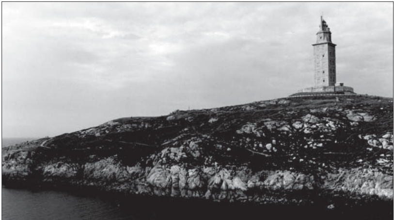
Torre de Hércules, en la ciudad de A Coruña.

De hecho, los autores clásicos suelen hacer mención al mismo en sus obras. Por ejemplo, Aristóteles escribió en “Noticias maravillosas” sobre la existencia de una senda que discurre de Italia a la península Ibérica, por la que transitaban peregrinos que eran protegidos en su periplo por las gentes que habitaban en sus márgenes. Lo denomina “camino Heracleo” en recuerdo del mítico camino por el que transitó Hércules desde Italia a Iberia (la península Ibérica), y de ahí hacia una isla en medio del Atlántico (clara alusión al paraíso celta). Así aparece recogido en la “Teogonía de Hesíodo” a finales del siglo VIII o comienzos del VII a. C. Hércules se dirigió hacia Iberia en su “décimo trabajo”. Precisamente en el territorio ocupado en la actualidad por la ciudad de La Coruña, el héroe griego se enfrentó al gigante Gerión, rey de la zona, derrotándolo y enterrando su cabeza donde se erige la espectacular Torre de Hércules, el faro romano más antiguo de Europa que continúa en funcionamiento, y que es patrimonio de la humanidad. En su viaje, Hércules siguió la senda estelar trazada por la Vía Láctea, el mismo trayecto que realiza el Sol de Oriente a Occidente en el curso del año.