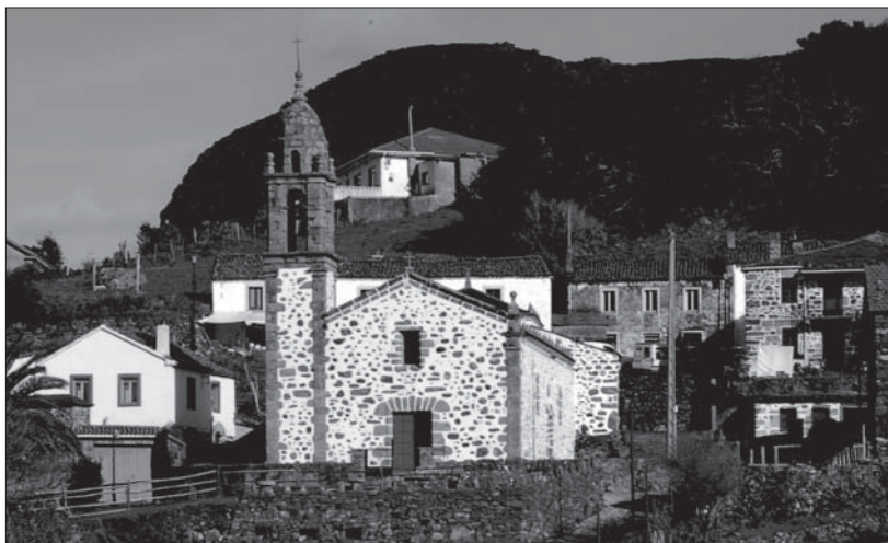
Iglesia y aldea de San Andrés de Teixido.

Otros cronistas, como Flavio, Plinio o Ptolomeo, aluden en sus escritos a esta isla de los difuntos, situada a varios días de na-