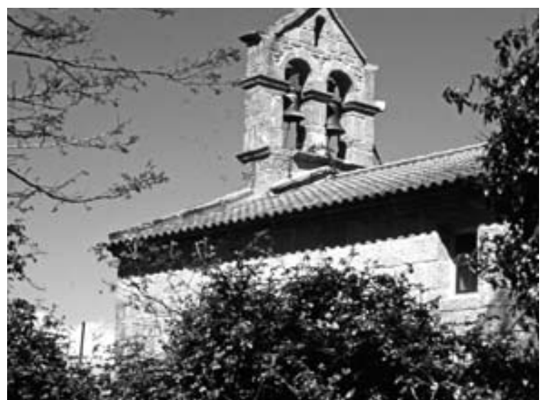
Santuario da Nosa Señora de Augasantas Cotobade, fonte cercana ao santuario, ponte nova de Cotobade, ponte de Pontesampaio, ermida de Santa Comba en Bértola (de esq. a dta. e de arriba a abaixo).

pouco se sabe, ten numerosas igrexas consagradas ás que se lles atribúen estrañas capacidades, como á de Bértola, no municipio de Vilaboa.