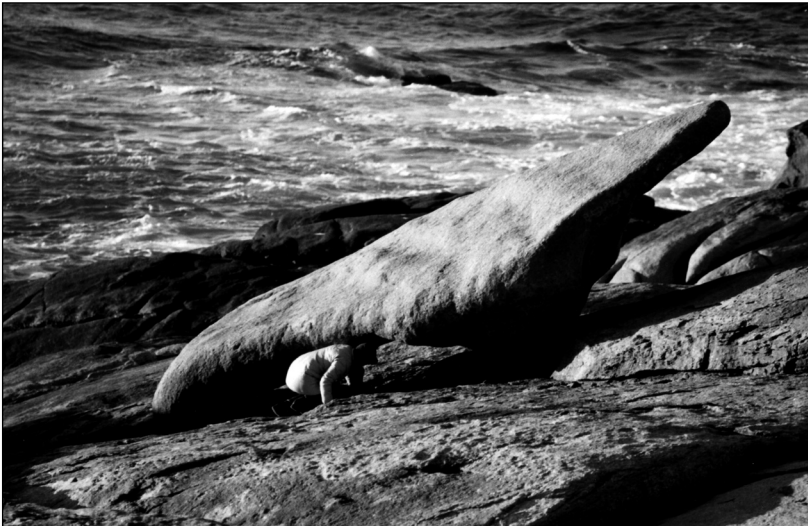
Una mujer pasa por debajo de la Pedra dos Cadrís de Muxía.

Los ritos y curaciones milagrosas forman parte de la magia desde que los seres humanos comenzaron a creer en seres superiores capaces de ‘saltarse’ las leyes naturales. Dar vueltas a una piedra, pasar por debajo de una roca de raras formas, darse cabezazos contra un santo, bañarse en determinada playa un número exacto de veces o incluso copular en determinados lugares con el fin de romper con la infertilidad son prácticas que, a lo largo de este libro lo veremos, aún persisten en determinados lugares de Galicia. Y tanta es su fama, que incluso vienen personas de otros puntos de España para cumplir los ritos y obtener su supuesto beneficio.