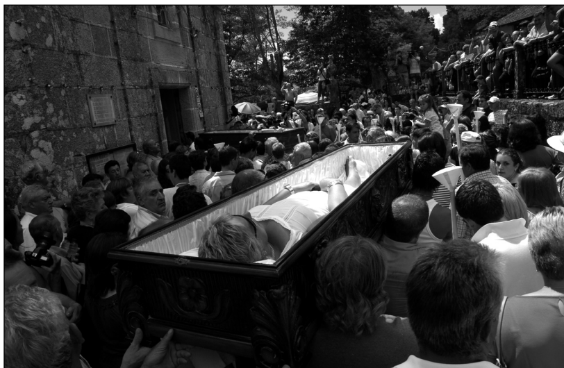
Dos ofrecidos en el interior de ataúdes en Santa Marta de Ribarteme.

Otro grupo de lugares escogidos para este libro guarda relación con antiguos cultos, lugares que desde antiguo fueron considerados como sagrados, amparados por creencias anteriores a la llegada del cristianismo en Galicia o incluso los hay que tienen un culto católico, aunque guardan reminiscencias paganas. Asimismo, los hay modernos, que a través de un lenguaje simbólico, generalmente relacionado